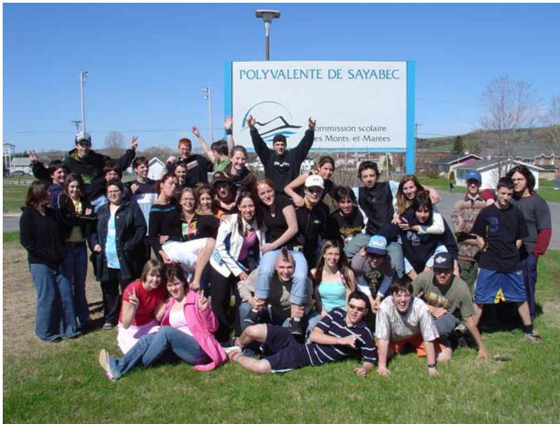
Finissants 4 e secondaire